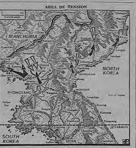
Los Nor Coreanos con la ayuda de los chinos, amenazaron gravemente a las fuerzas de las NN. UU. en Ulsan (dentro del círculo) en donde unos batallones de tropas aliadas fueron rodeados y sitiados.