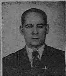
países que vayan visitando.

En los primeros días del próximo mes de noviembre comenzará a circular la revista "VISION", en español, para todos los países latino-americanos. La casa editora tiene como sede a la ciudad de Nueva York y a la empresa se encuentran vinculados capitales norte y sur americanos. Igualmente, en el personal técnico y periodístico se cuentan numerosos latino-americanos.